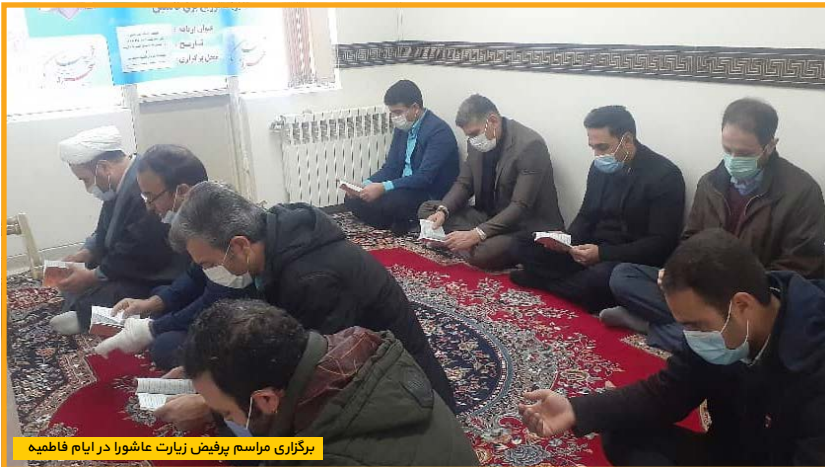
برگزاری مراسم پرفیض زیارت عاشورا در ایام فاطمیه