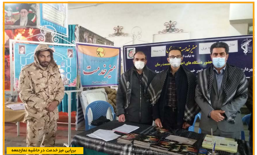
برپایی میز خدمت در حاشیه نماز جمعه