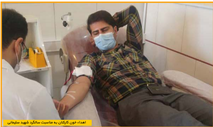
اهداء خون کارکنان به مناسبت سالگرد شهید سلیمانی