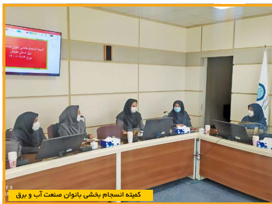
کمیته انسجام بخشی بانوان صنعت آب و برق