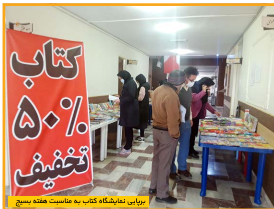
برپایی نمایشگاه کتاب به مناسبت هفته بسیج