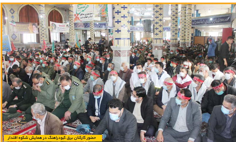
حضور کارکنان برق کیودراهنگ در همایش شکوه اقتدار