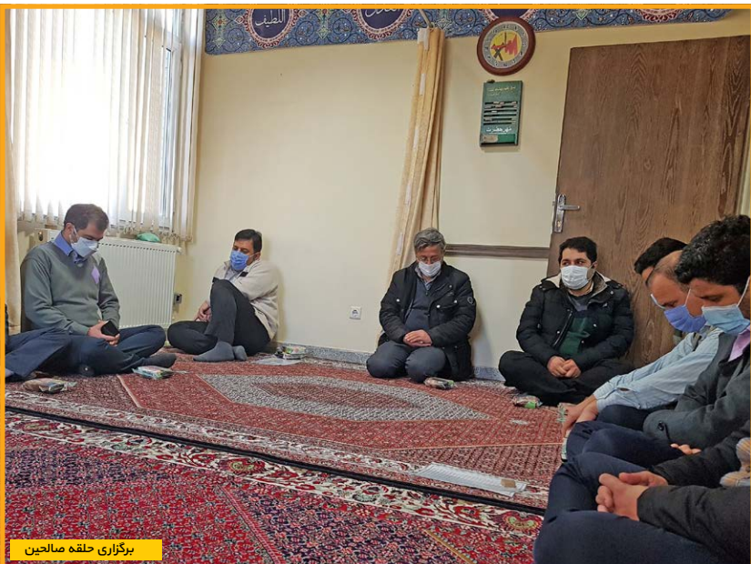
برگزاری حلقه صالحین