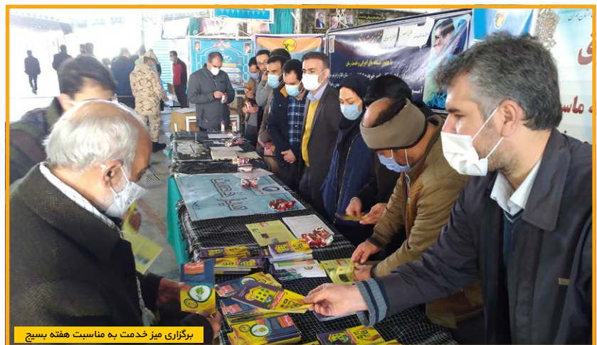
برگزاری میز خدمت به مناسبت هفته بسیج