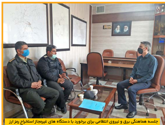
جلسه هماهنگی برق و نیروی انتظامی برای برخورد با دستگاه‌های غیرمجاز استخراج رمز ارز