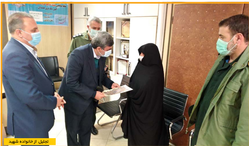
تجلیل از خانواده شهید