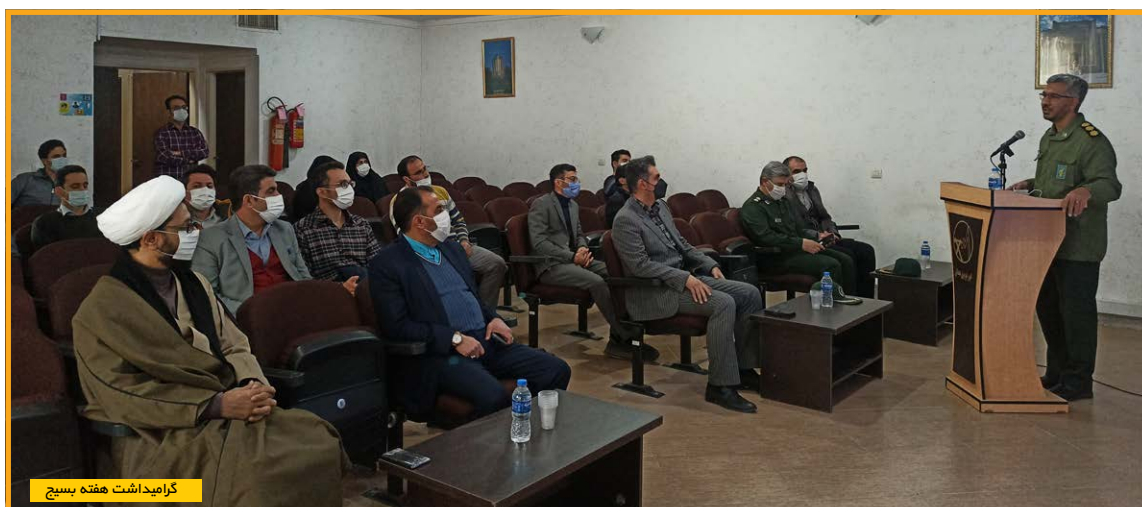
گرامی‌داشت هفته بسیج