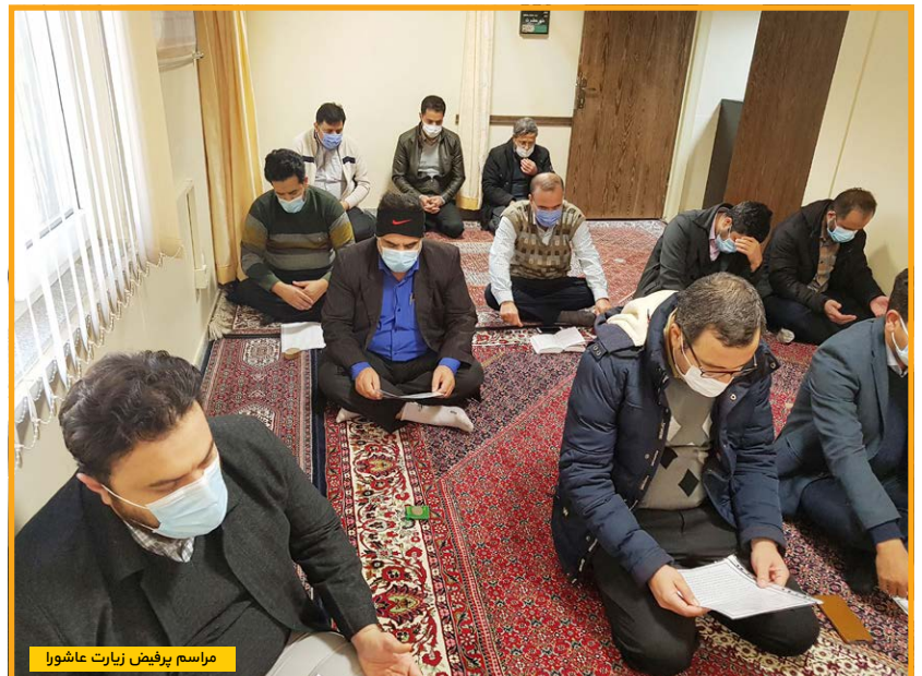
مراسم پرفیض زیارت عاشورا