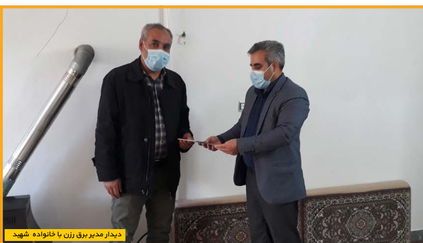
دیدار مدیر برق رزن با خانواده شهید