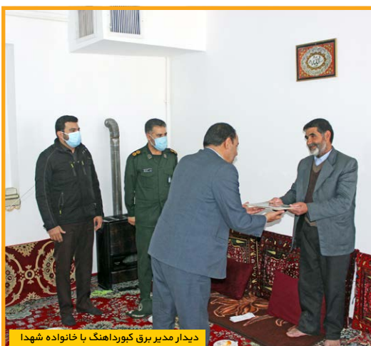
دیدار مدیر برق کیودراهنگ با خانواده شهدا