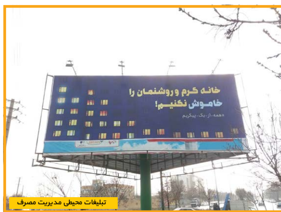
تبلیغات محیطی مدیریت مصرف