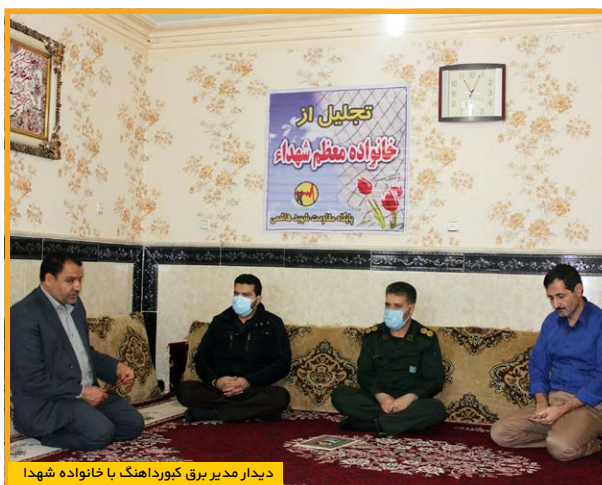
دیدار مدیر برق کیودراهنگ با خانواده شهدا