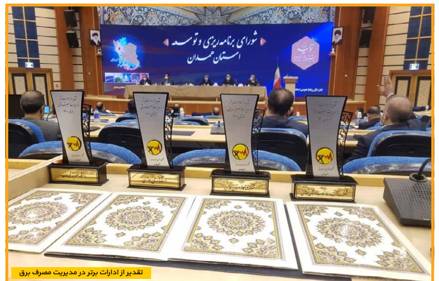
تقدیر از ادارات برتر در مدیریت مصرف برق