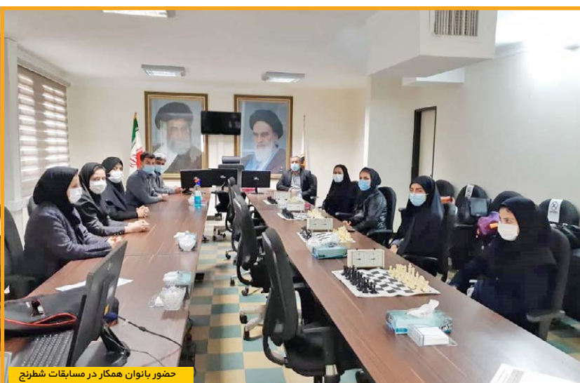
حضور بانوان همکار در مسابقات شطرنج