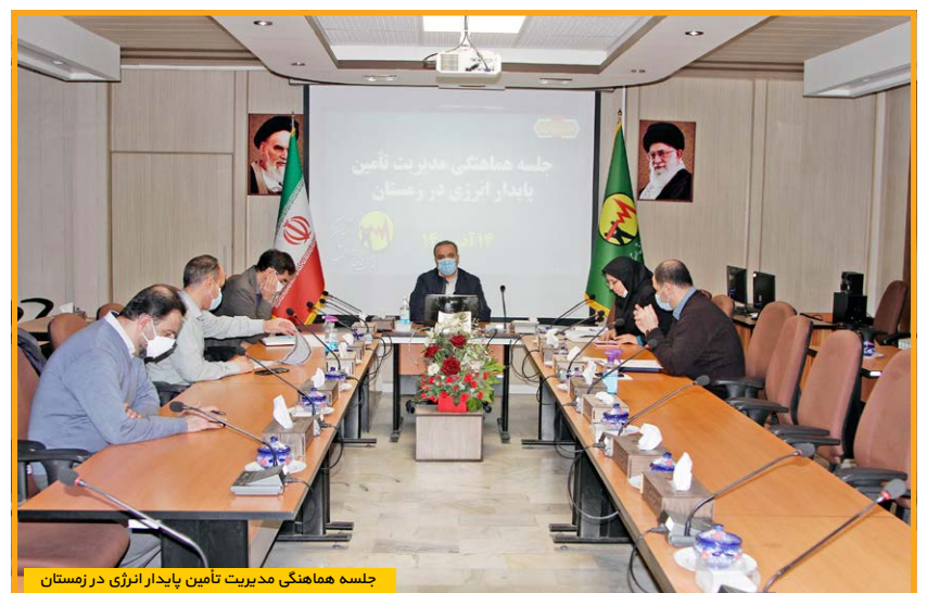
جلسه هماهنگی مدیریت تأمین پایدار انرژی در زمستان