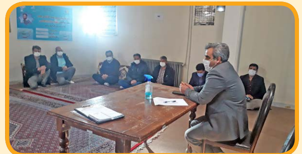
جلسه گردهمایی ایمنی با حضور کارکنان بهره برداری در نمازخانه برق رزن برگزار شد.