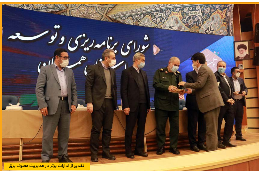
تقدیر از ادارات برتر در مدیریت مصرف برق