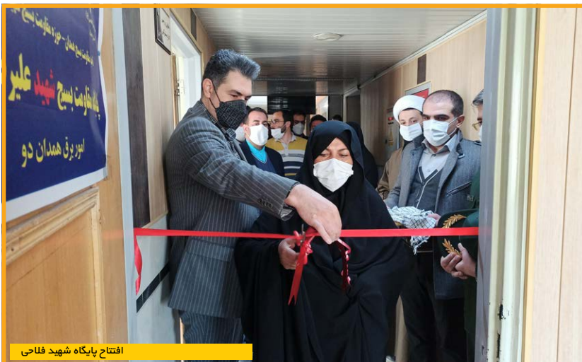
افتتاح پایگاه شهید فلاحی