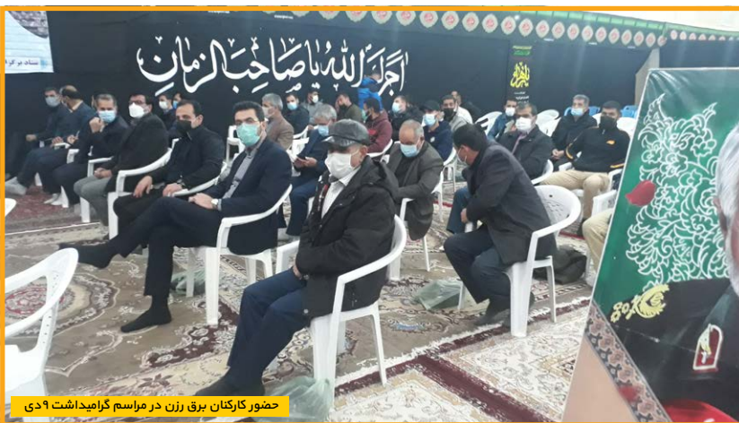
حضور کارکنان برق رزن در مراسم گرامیداشت ۹ دی