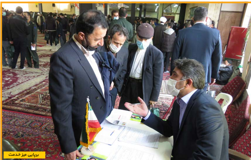
برپایی میز خدمت