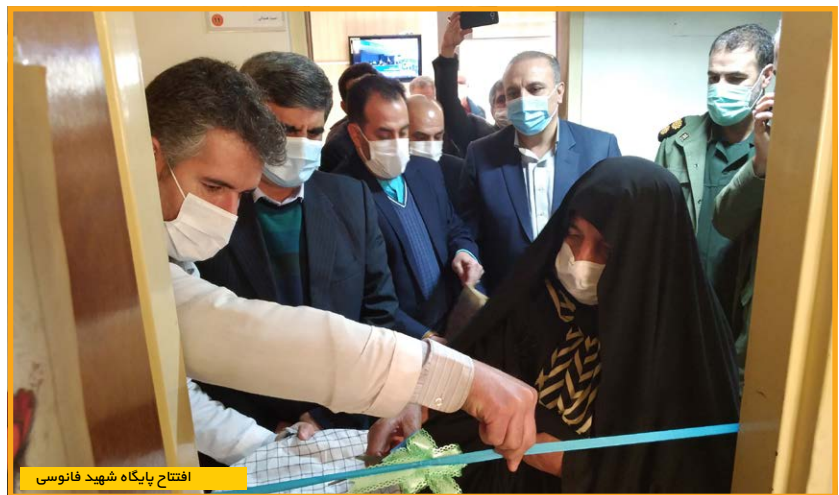
افتتاح پایگاه شهید فاتوسی