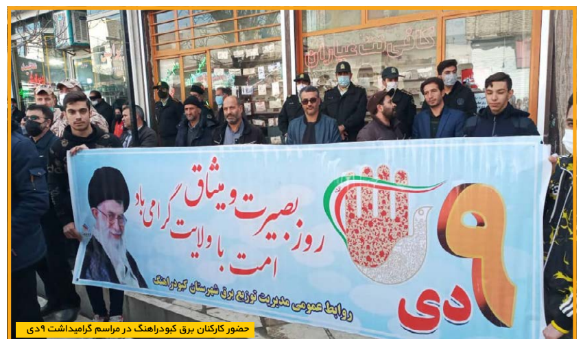
حضور کارکنان برق کیودراهنگ در مراسم گرامی داشت ۹ دی