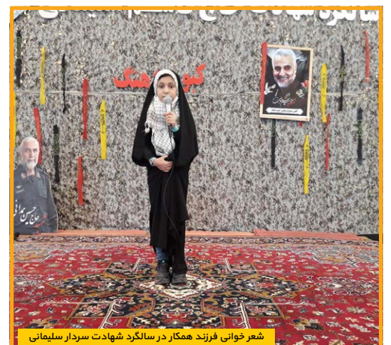
شعر خوانی فرزندی همکار در سالگرد شهادت سردار سلیمانی