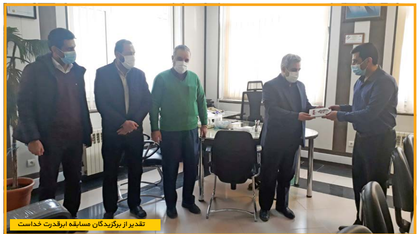
تقدیر از برگزیدگان مسابقه ابرقدرت خداست