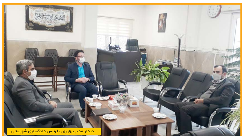
دیدار مدیر برق رزن با رئیس دادگستری شهرستان