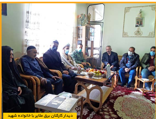
دیدار کارکنان برق ملایر با خانواده شهید