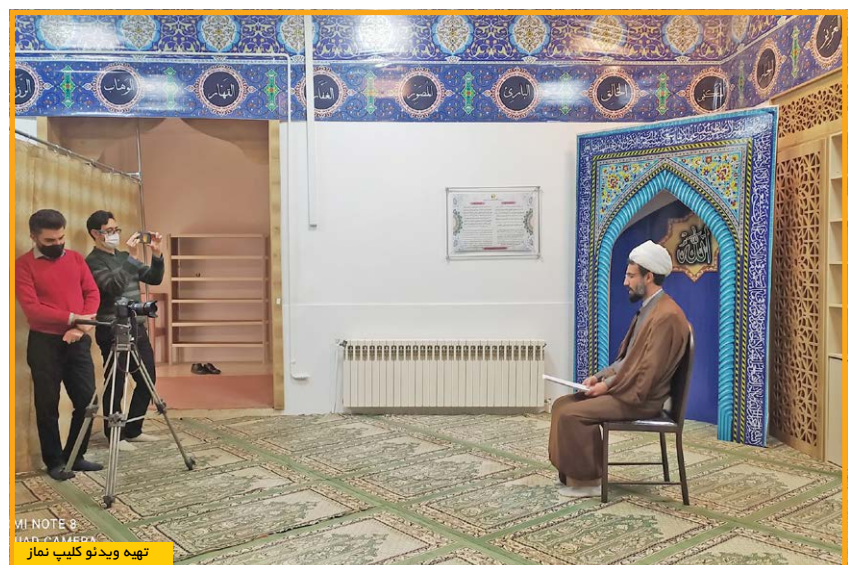
تهیه ویدئو کلیپ نماز