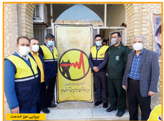
برپایی میز خدمت