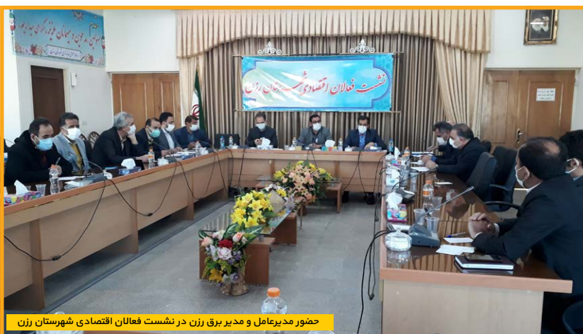
حضور مدیرعامل و مدیر برق رزن در نشست فعالان اقتصادی شهرستان رزن