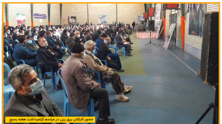
حضور کارکنان برق رزن در مراسم گرامیداشت هفته بسیج