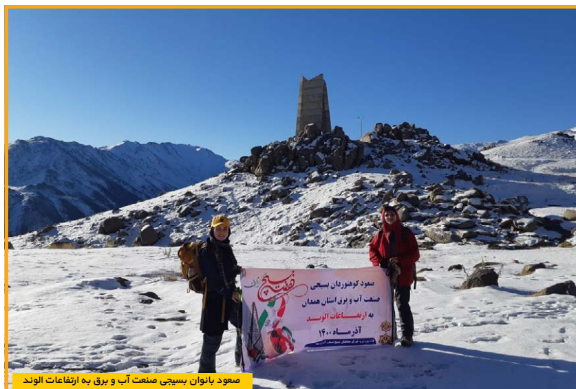
صعود بانوان بسیجی صنعت آب و برق به ارتفاعات الوند